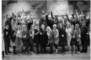
Sandnes Operakor

Gand kirke på onsdager. For nå er onsdagskveldene opptatt hos oss. Sandnes operakor har hatt noen øvelser hos under pandemien, når det har vært mulig. De liker seg så godt, at vi nå har inngått en fast avtale med koret om øvelser hos oss på onsdager. Det er gledelig, og vi ønsker velkommen! Vi gleder oss over økte leieinntekter, men minst like gledelig er det at begge kor vil synge på arrangement i kirken vår. Vi ser frem til samarbeid med to flotte og dyktige kor!